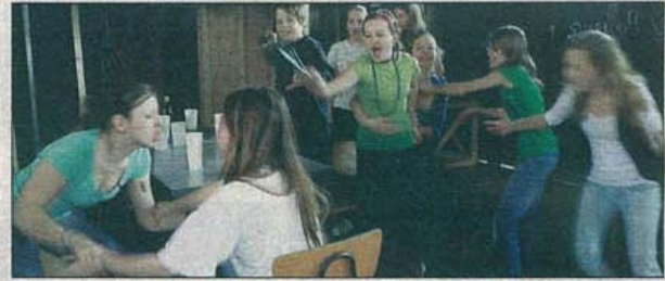
Einige der Jugendlichen vom Landestheater-„Theaterstudio“ (Landestheater Linz)